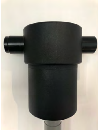
Abb.1: Filter komplett

Durch die angebrachte Entnahmeöse lässt sich dieser einfach und schnell zur Wartung entnehmen.