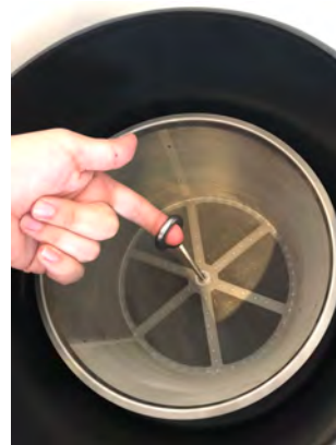
Abb. 4: Entnahme des Filterkorbes aus dem Gehäuse