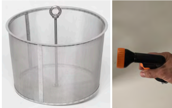
Abb.3: Filter beim Reinigen mit einer Spritzpistole